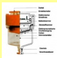
BARDAHL SPECIAL Haft/Kettenschmierstoff SM-Geber A125